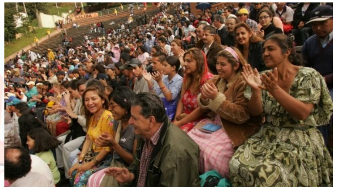
Reunión del pueblo rom.

culturales como la idea de un origen común, valoración del grupo en cuanto la edad y el género, y diferenciación frente al no rom, lo diferencian de los demás grupos étnicos del país. El pueblo rom o gitano se encuentra distribuido en kumpanias, que son unidades variables, de coresidencia que se asientan en barrios. También, se dispersan por familias, entre los habitantes no gitanos de los sectores populares de las ciudades.